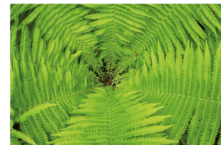
Strutbräken ( Matteuccia struthiopteris ) är kanske den pampigaste av alla ormbunkar som växer längs Hökesån. Man känner igen den på att bladen sitter som en tydlig tratt. Mitt i trattens väder växer framåt sommaren upp speciella blad som ormbunken sprider sina sporer från.