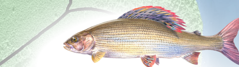
Harr ( Thymallus thymallus ) trivs bara i riktigt kallt vatten och har sin sydligaste svenska förekomst i Vättern. Den är en uppskattad matfisk, men beståndet i Vättern visar tyvärr tecken på att minska. Illustration: Thommy Gustavsson.