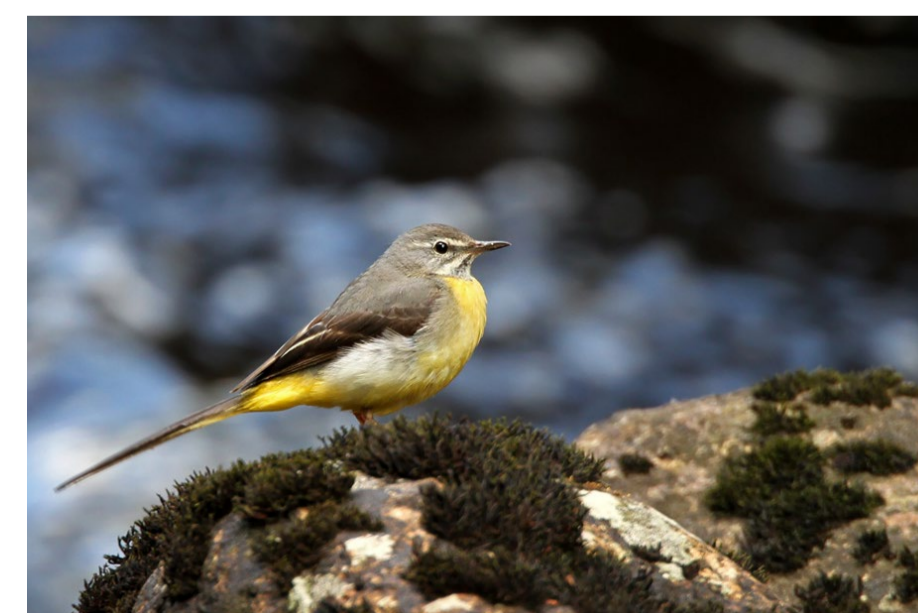
Forsärla ( Motacilla cinerea ) håller gärna till i Hökesåns snabbt strömmande vatten där den letar föda både under och ovan vattenytan. Vid Spinnets kan man höra dess genomträngande läte redan tidigt på våren.